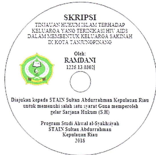
Contoh Label CD