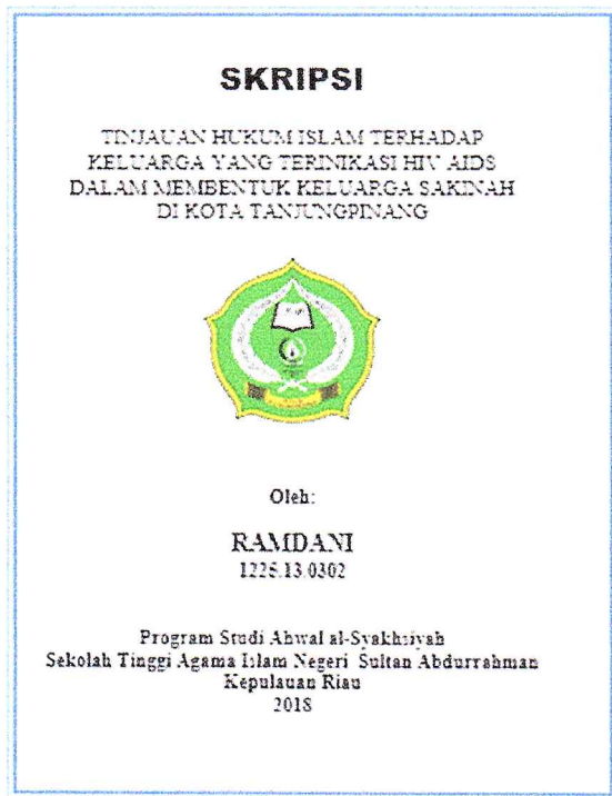
Contoh label Cover kotak CD